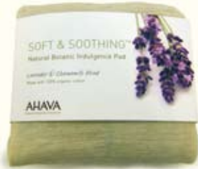
Soft & Soothing Natural Botanic Indulgent Pad €26